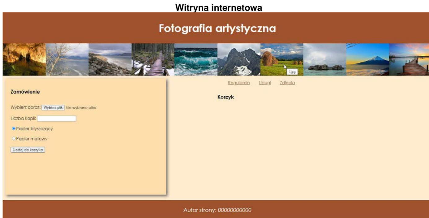
Ilustracja 2. Wygląd strony internetowej w przeglądarce Chrome, widać dymek dla obrazu 7.jpg